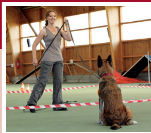
Aufbau von Aufmerksamkeit und Spannung durch eine klare und bewusste Körpersprache.

Das Longieren ist rassenunabhängig. Vom kleinsten bis zum grössten vierbeinigen Vertreter, alle Hunde können davon