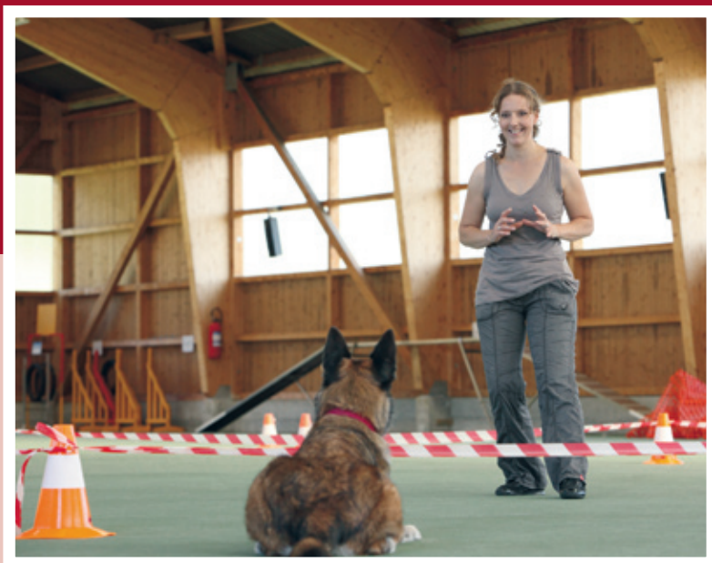
Distanz schafft Raum für Spannung und Verständigung.