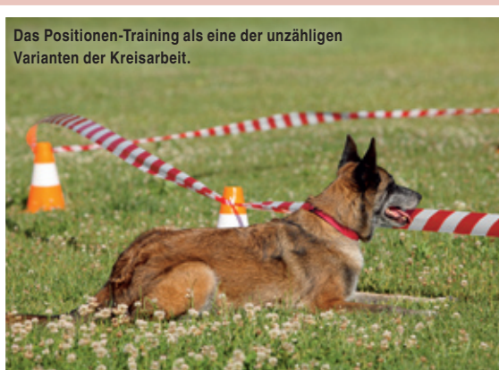
Das Positionen-Training als eine der unzähligen Varianten der Kreisarbeit.

Das Setzen und Respektieren von Grenzen ist ein weiteres Grundthema des Longierens. Der Innenbereich des Kreises gehört dem Menschen, der Aussenbereich dem Hund. Jeder Hund reagiert beim Kennenlernen des ausgesteckten Kreises anders. Manche respektieren das Band sofort und bleiben ohne Probleme draussen, währenddessen sich ihr Mensch in den Kreis begibt. Andere hüpfen immer wieder mal in den Kreis, und wieder an-