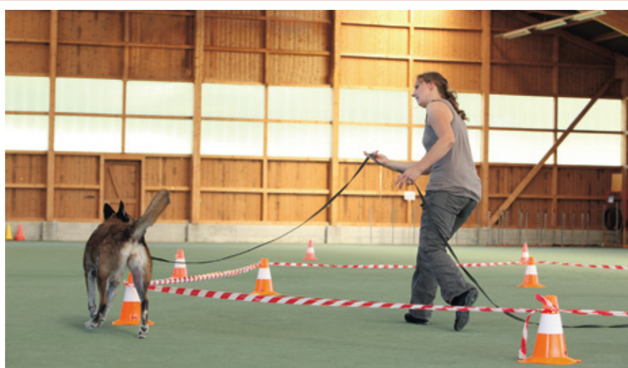
Die Distanz wird kontinuierlich aufgebaut, die Longe ist lediglich ein Hilfsmittel zu Beginn.