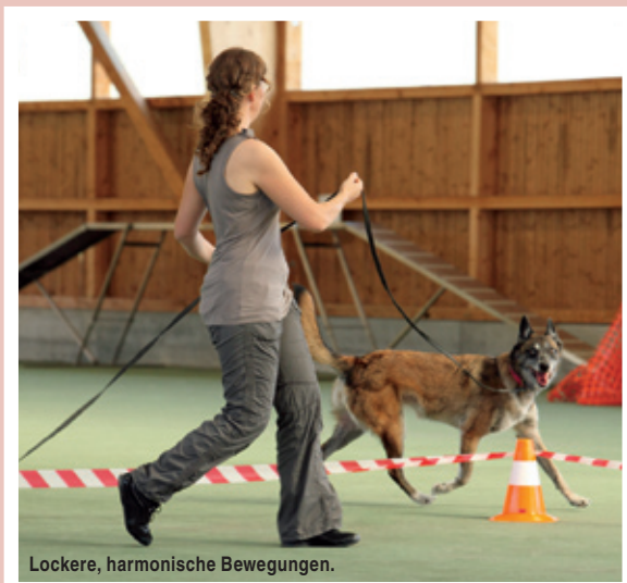
Lockere, harmonische Bewegungen.

profitieren. Jeder Hund zeigt im Kreis seinen individuellen Charakter, den es zu respektieren gilt. Auch ältere Hunde finden Gefallen daran. Sie werden weiterhin gefordert und können die Gangart ihrer körperlichen Verfassung anpassen. Bei Hunden in der Rekonvaleszenz kann durch vorsichtiges Kreistraining die Muskulatur und die Kondition wieder langsam und kontrolliert aufgebaut werden.