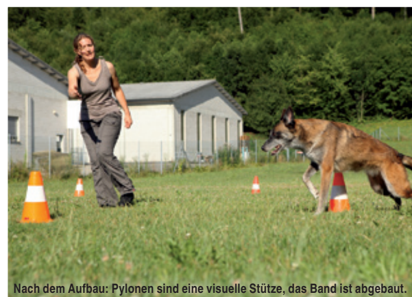
Nach dem Aufbau: Pylonen sind eine visuelle Stütze, das Band ist abgebaut.

dere scheinen das Band gar nicht wahr zu nehmen und drängen ständig zum Hundeführer. Kein Hund soll mit Gewalt oder Grobheit aus dem Kreis gestossen werden. Der Mensch soll respekt- und liebevoll, bestimmt und bewusst mit seiner Körperhaltung und Signalen mitteilen, was er vom Hund verlangt. Der Zweibeiner lernt auch, den Hund zu beobachten und zu lesen, ohne ihn dabei zu fixieren und zu manipulieren.